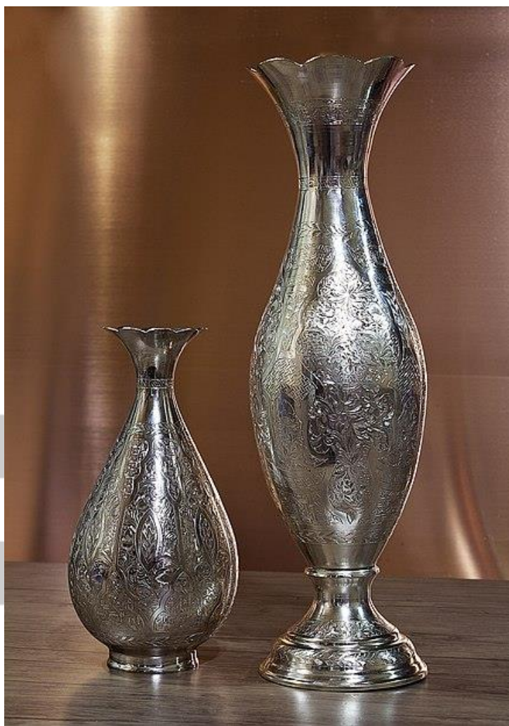
صنایع دستی فلزی

بود. از دیگر زیر مجموعه‌های صنایع دستی رودوزی می‌توان به خامه دوزی، چشمه دوزی، ستاره دوزی، گلابتون دوزی، سیاه دوزی و مخمل دوزی اشاره کرد. این هنر زیر شاخه‌های زیادی دارد که هر کدام از آن‌ها به شهرهای مختلفی مربوط هستند.