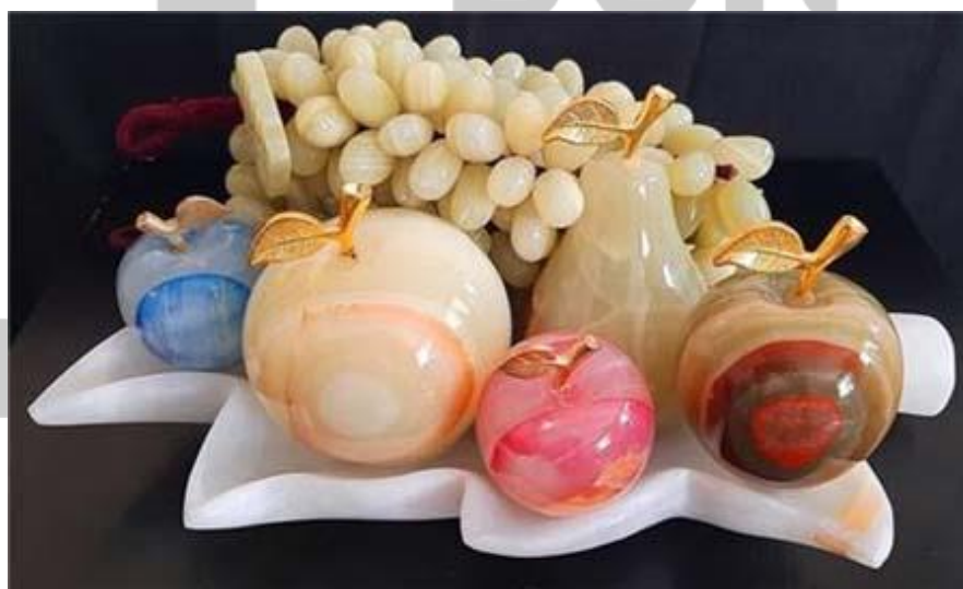
صنایع دستی سنگی

صنایع دستی چوبی از زیباترین آثار هنری ایرانی هستند که ساخت آن‌ها از سالیان دور تاکنون در ایران رواج دارد. این صنایع بسیار گسترده هستند و هنرمندان زیادی در آن فعالیت می‌کنند. شهرهای مختلف ایران صنایع دستی متنوع چوبی دارند که از میان آن‌ها می‌توان به خراطی، ساخت معرق، منبت کاری، خاتم کاری و مشبک اشاره کرد. آثار هنری ساخت دست صنعتگران چوب در زندگی روزمره استفاده زیادی دارند. یکی از پرطرفدارترین آثار و صنایع دستی چوبی، آثار منبت کاری هستند.