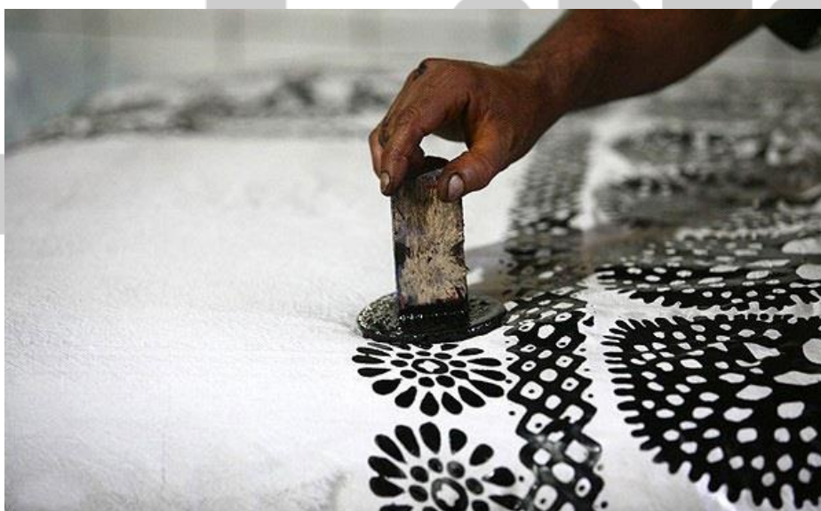
صنایع دستی چاپ سنتی

از صنایع دستی نیز به شمار می‌رود. نمونه‌های برجسته‌ای از نگارگری ایرانی را می‌توانید در موزه رضا عباسی تهران مشاهده کنید.