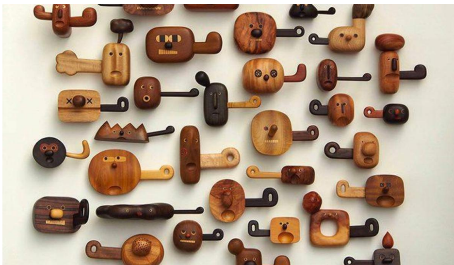
صنایع دستی چوبی

صنایع دستی چوبی از زیباترین آثار هنری ایرانی هستند که ساخت آن‌ها از سالیان دور تاکنون در ایران رواج دارد. این صنایع بسیار گسترده هستند و هنرمندان زیادی در آن فعالیت می‌کنند. شهرهای مختلف ایران صنایع دستی متنوع چوبی دارند که از میان آن‌ها می‌توان به خراطی، ساخت معرق، منبت کاری، خاتم کاری و مشبک اشاره کرد. آثار هنری ساخت دست صنعتگران چوب در زندگی روزمره استفاده زیادی دارند. یکی از پرطرفدارترین آثار و صنایع دستی چوبی، آثار منبت کاری هستند.